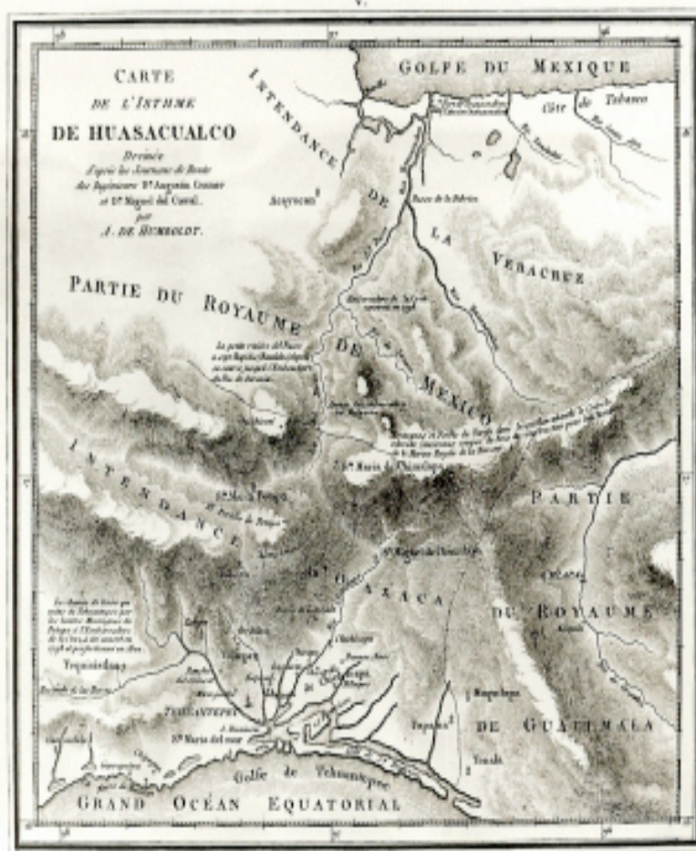
Alexander von Humboldt rajzmetszetei a Nicaragua-csatornáról 1811-ből FOXMAN, Simone: Nicaragua still thinks it can build a better canal than Panama after 200 years of trying. Quartz. (2013. június 13.) Forrás: http://qz.com/93707/nicaragua-still-thinks-it-can-build-a-better-canal-than-panama-after-200-years-of-trying/ (Hozzáférés: 2015. február 8.)