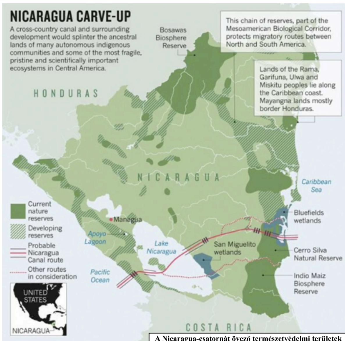
A Nicaragua-csatornát övező természetvédelmi területek